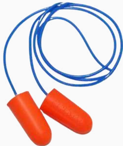
TAPÓN AUDITIVO DESECHABLE KTAB