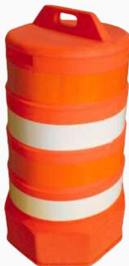
TRAFITAMBO SIN BASE C/REFL KPTRF01