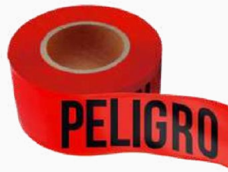
CINTA DELIMITANTE PELIGRO 305M KPCD02