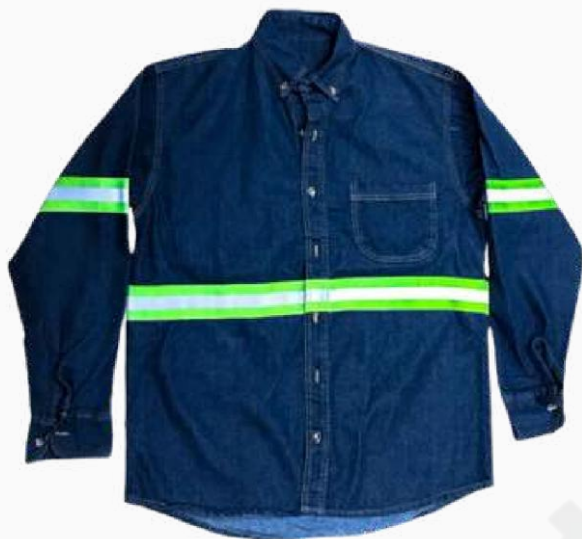
CAMISA DE MEZCLILLA 8" C/REFL AMA KCMCR01