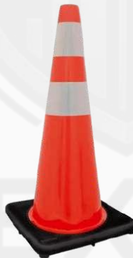
CONO DE VIALIDAD 71 CM C/REFL KPCON71