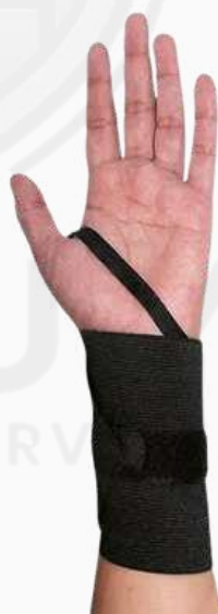
MUÑEQUERA ELÁSTICA 3"