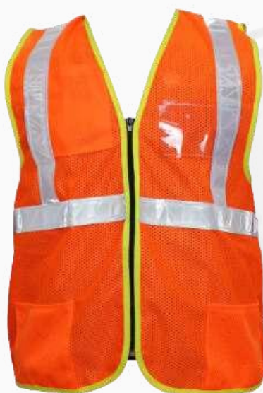
CHALECO PERFORADO C/REFL