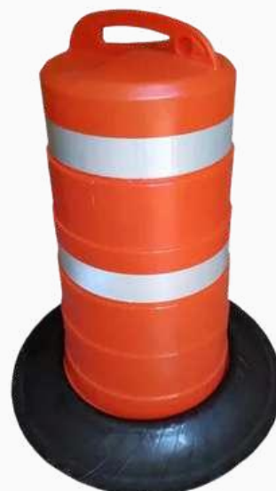
TRAFITAMBO CON BASE C/REFL KPTRF