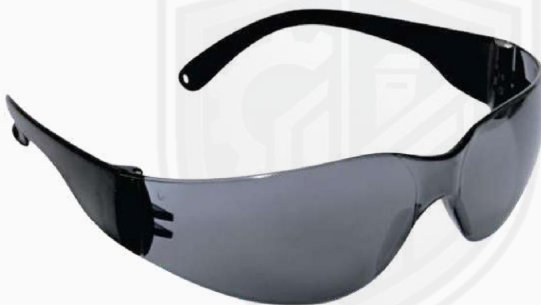
LENTE OVALADO OBSCURO KLOB02