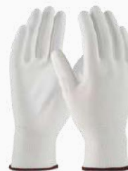
GUANTE 100% POLIÉSTER GPOL