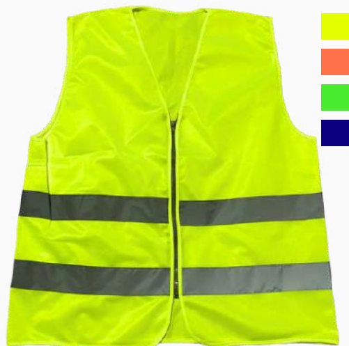
CHALECO ALTA VISIBILIDAD CLASE II