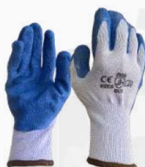
GUANTE ALGODÓN PALMA LATEX GAPL