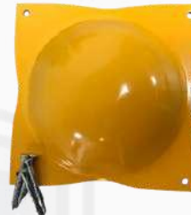
BOYA VIAL METÁLICA KPBOYV