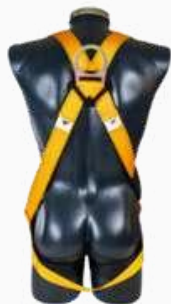
ARNÉS C/CAÍDA CUERPO COMPLETO 1 ARGOLLA