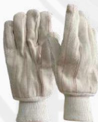
GUANTE LONA DOBLE PALMA GLDP