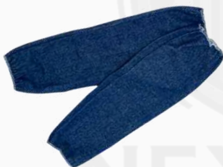
MANGA MEZCLILLA C/ELÁSTICO KPMME