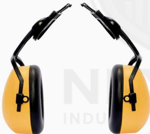
OREJERA JYRSA P/CASCO DIELÉCTRICA JYR703