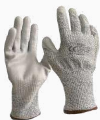
GUANTE ANTICORTE GAC5