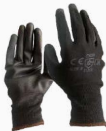
GUANTE NYLON PALMA PU GNPU