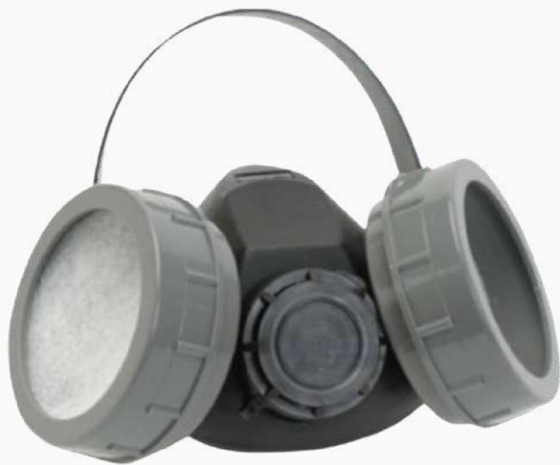
RESPIRADOR DE MEDIA CARA 2 VÁLVULAS S/CARTUCHO