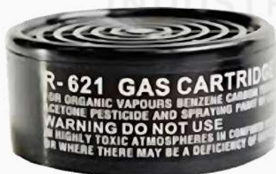
CARTUCHO CONTRA VAPORES ORGÁNICOS