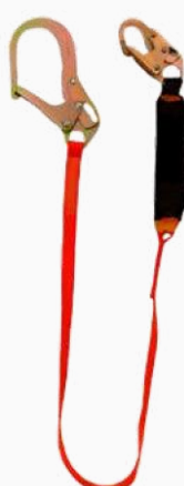
LÍNEA DE VIDA C/AMORTIGUADOR BANDA INDIV GANCHO GDE