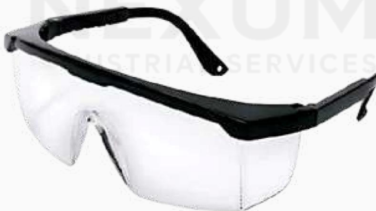
LENTE CLARO CON CEJA NEGRA KLCS01