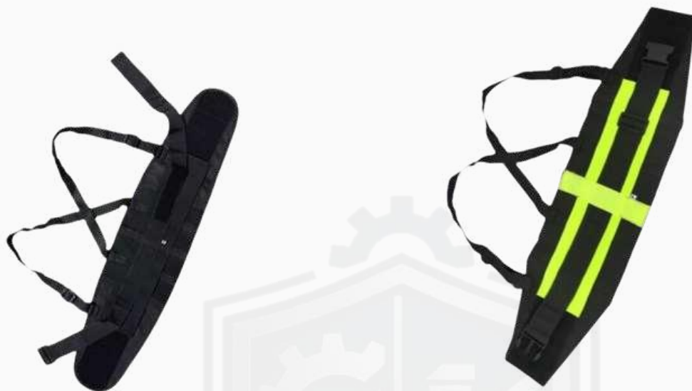
FAJA ELÁSTICA CURVA K535