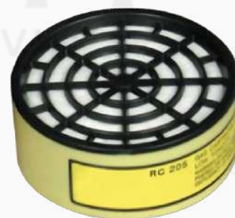
CARTUCHO CONTRA GASES ÁCIDOS