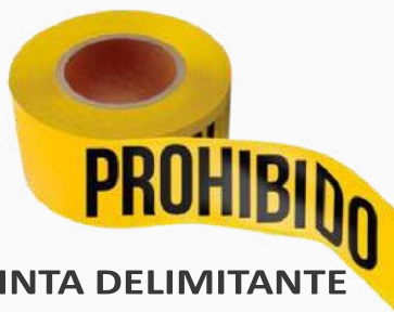
CINTA DELIMITANTE PROHIBIDO 305M KPCD01