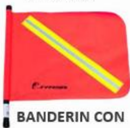
BANDERIN CON REFLEJANTE BANJYR