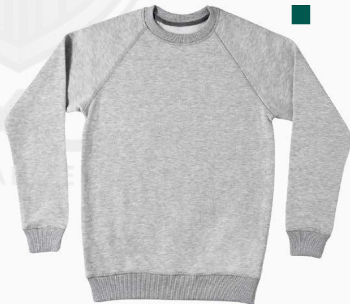
SUDADERA CUELLO REDONDO SCR01