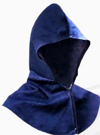
CAPUCHA MEZCLILLA C/CIERRE CMCC