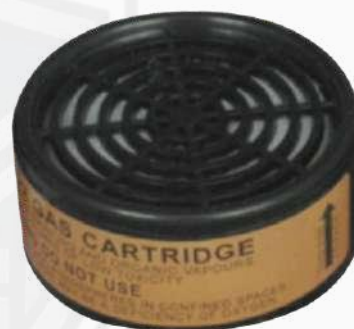
CARTUCHO CONTRA VAPORES ORGÁNICOS Y PINTURAS