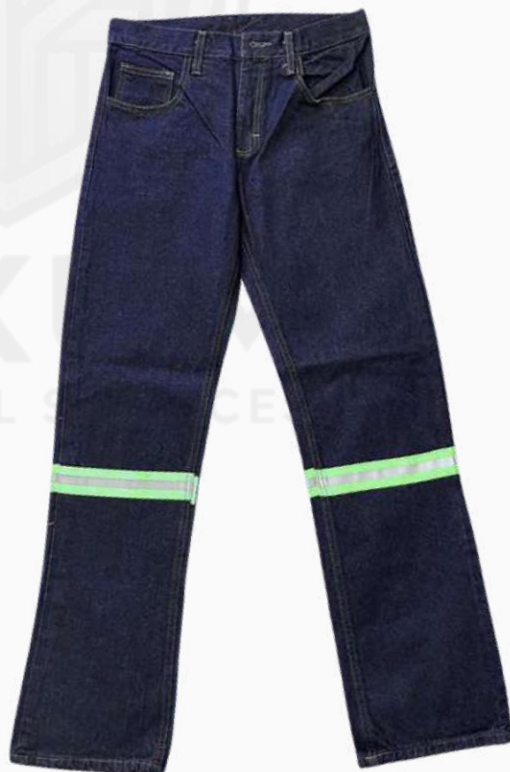
PANTALÓN DE MEZCLILLA 14" C/REFL KPPMZ