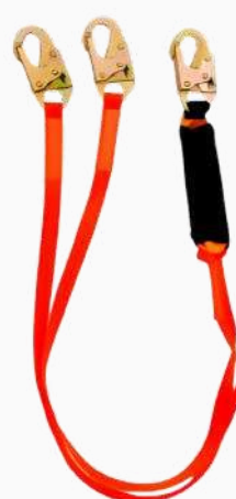
LÍNEA DE VIDA C/AMORTIGUADOR BANDA DOBLE GANCHO CH