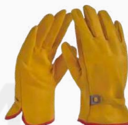
GUANTE ARGONERO GAR