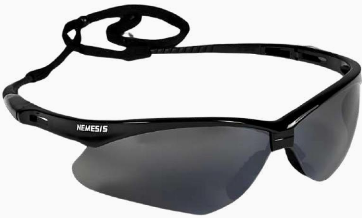
LENTES NEMESIS ESPEJO ARMAZON NEGRO LLEN01