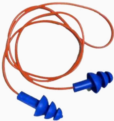
TAPÓN AUDITIVO REUTILIZABLE KTAR