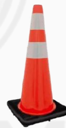
CONO DE VIALIDAD 45 CM C/REFL KPCON45