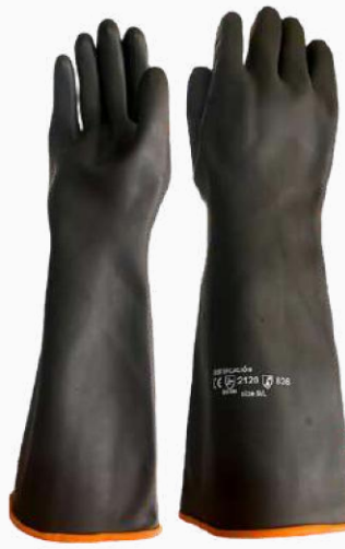
GUANTE DE LÁTEX CONTRA ÁCIDOS GLAC