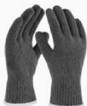
GUANTE 100% ALGODÓN GALG