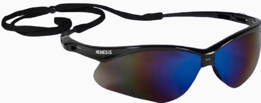
LENTES NEMESIS TORNASOL ARMAZON NEGRO