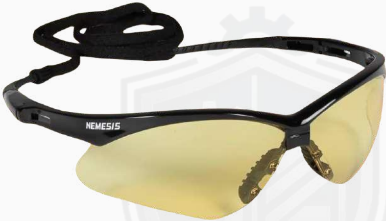
LENTES NEMESIS AMBAR ARMAZON NEGRO LLEN02