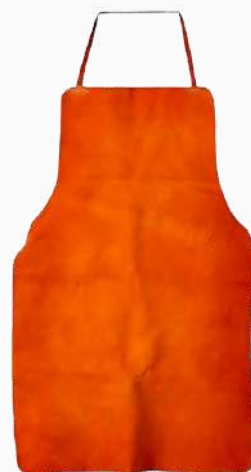
MANDIL CARNAZA C/CINTILLAS MC01