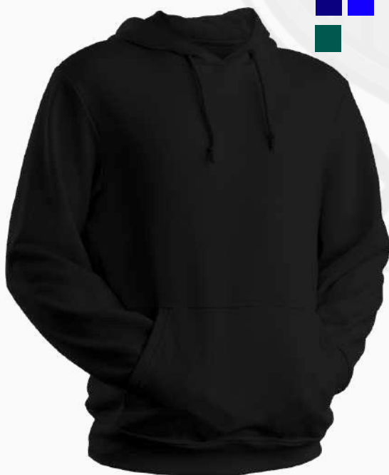
HOODIE C/CAPUCHA HSC01