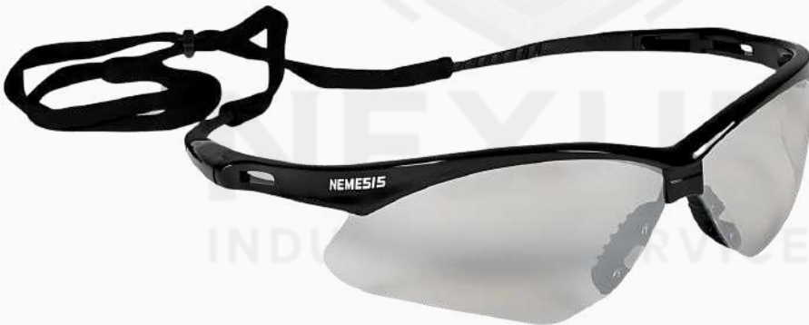
LENTES NEMESIS CLARO ARMAZON NEGRO LLEN03