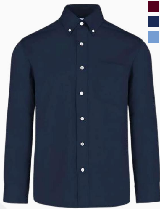
CAMISA MANGA LARGA GABARDINA CMLG01