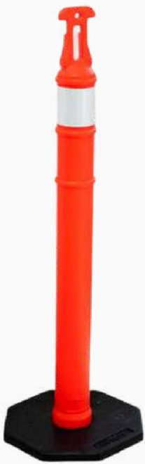
POSTE VIAL ALINEADOR KPVIAL