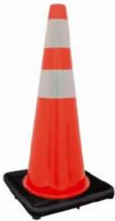
CONO DE VIALIDAD 91 CM C/REFLEJANTE KPCON91