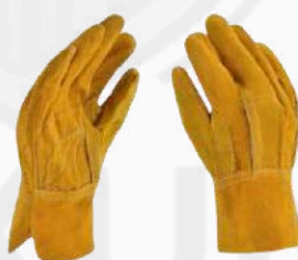
GUANTE DE CARNAZA CORTO GCC