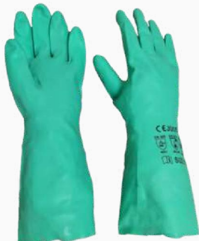
GUANTE NITRILO VERDE FLOCADO GNVF