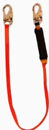
LÍNEA DE VIDA C/AMORTIGUADOR BANDA INDIV GANCHO CH