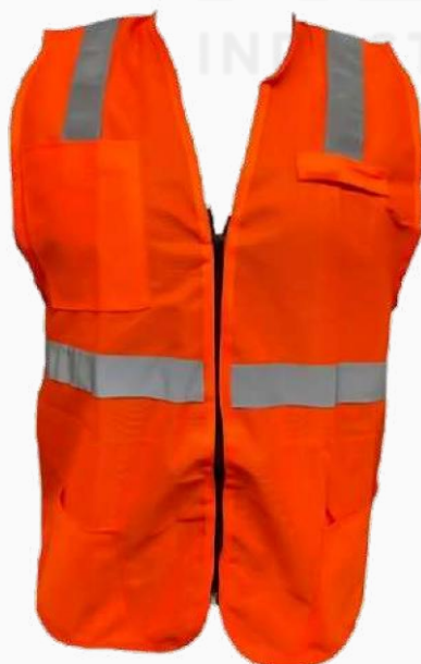
CHALECO ALTA VISIBILIDAD CON BOLSAS