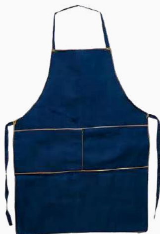
MANDIL MEZCLILLA C/BOLSAS SOBREHILADO MMCBS