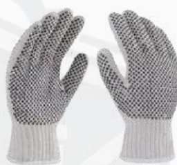
GUANTE PUNTOS PVC GPVC