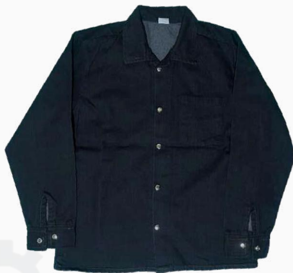
CAMISA DE MEZCLILLA 14" KCMSR01