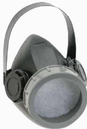
RESPIRADOR DE MEDIA CARA 1 VÁLVULA S/CARTUCHO