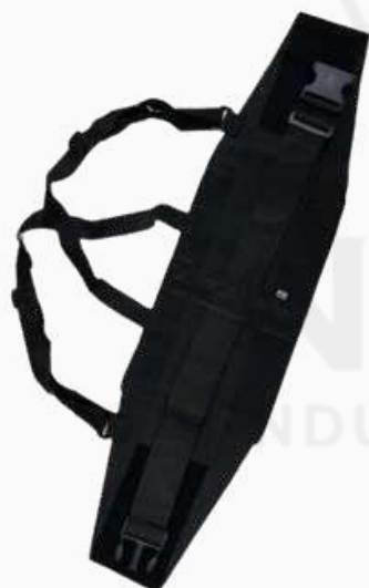
FAJA ELÁSTICA RECTANGULAR K635