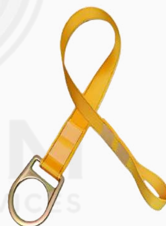
PUNTO DE ANCLAJE BANDA