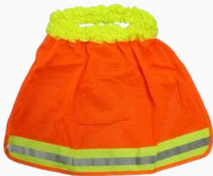
CUBRENUCA NJA C/REFL KCN01