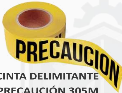
CINTA DELIMITANTE PRECAUCIÓN 305M KPCD03