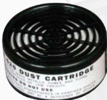
CARTUCHO CONTRA POLVOS Y VAPORES NO TÓXICOS