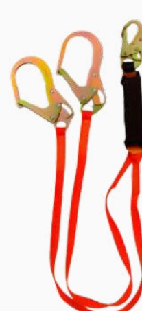
LÍNEA DE VIDA C/AMORTIGUADOR BANDA DOBLE GANCHO GDE