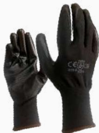
GUANTE NYLON PALMA NITRILO GNPN