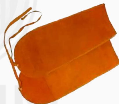
MANGA CARNAZA C/CINTILLAS MC02