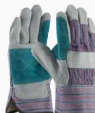
GUANTE CHINO DOBLE PALMA GCDP