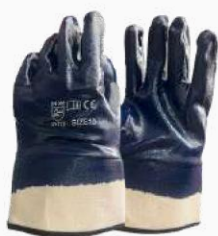
GUANTE NITRILO PUÑO LONA GNPL