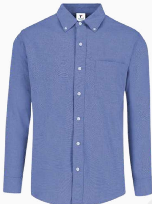
CAMISA MANGA LARGA OXFORD CMLO03