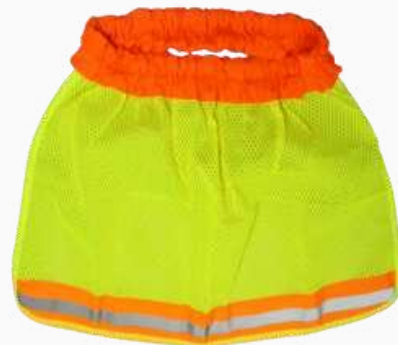
CUBRENUCA AMA C/REFL KCN02