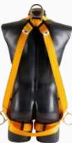
ARNÉS C/CAÍDA CUERPO COMPLETO 3 ARGOLLA