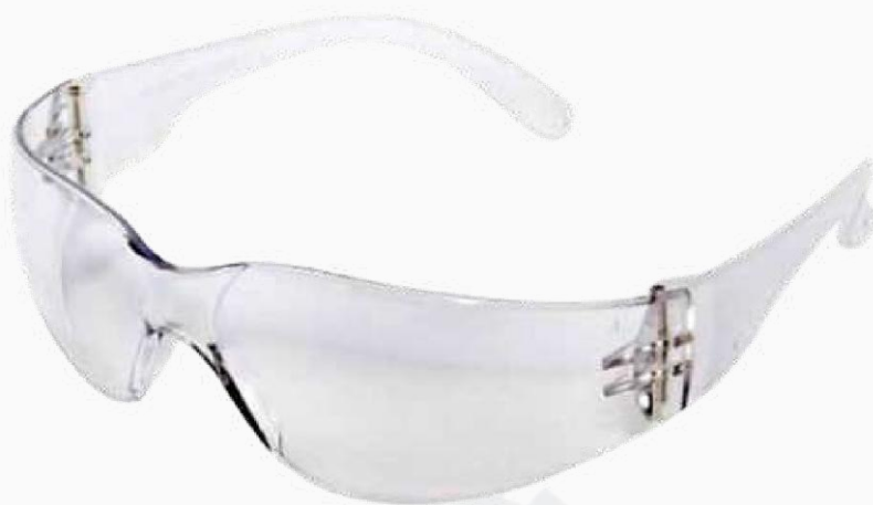
LENTE OVALADO CLARO KLC01