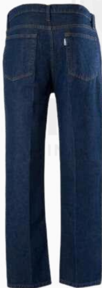
PANTALÓN DE MEZCLILLA 14" KPPMZ