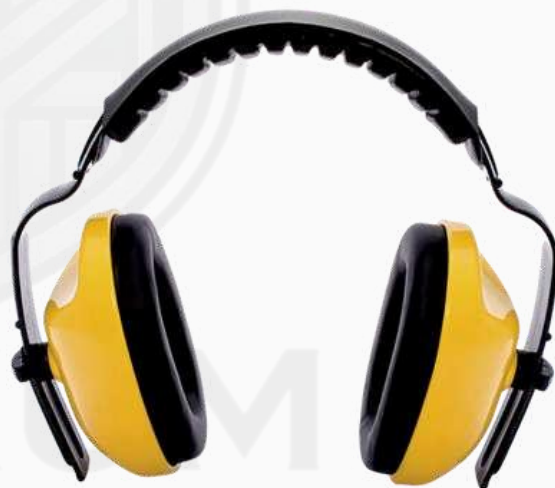
OREJERA JYRSA 29DB