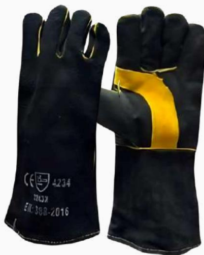
GUANTE SOLDADOR HILO KEVLAR GSOL