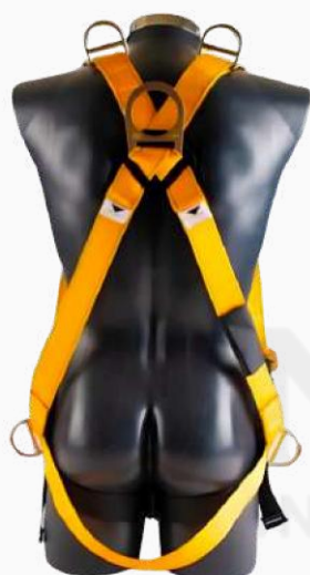
ARNES C/CAIDA CUERPO COMPLETO 5 ARGOLLA